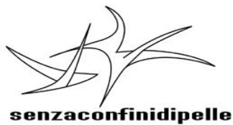
FOTO EDIZIONE 2018 > http://www.senzaconfinidipelle.com/images/foto%20asinara%202018/index.html